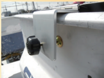
アイチコーポレーション